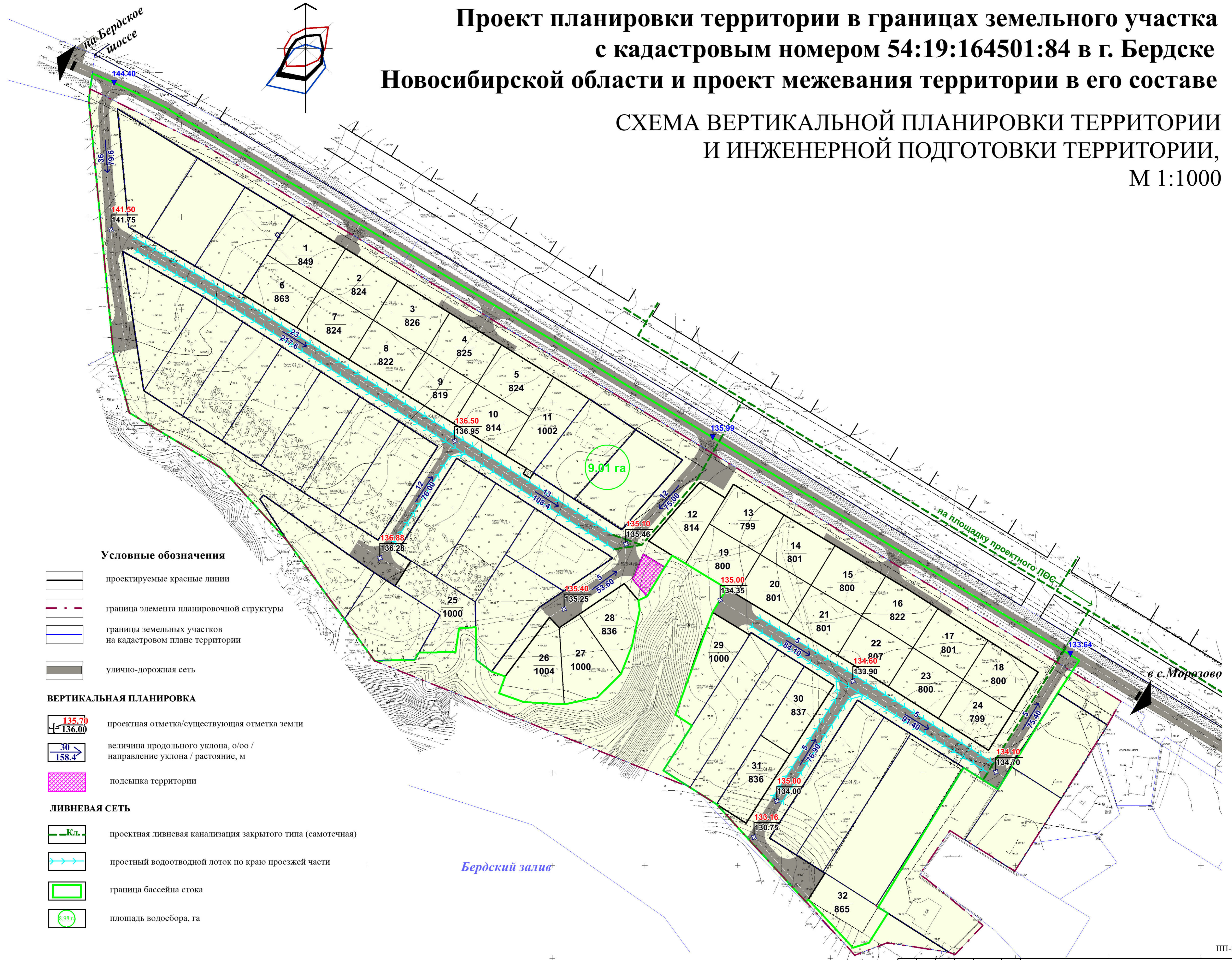
СХЕМА ВЕРТИКАЛЬНОЙ ПЛАНИРОВКИ ТЕРРИТОРИИ И ИНЖЕНЕРНОЙ ПОДГОТОВКИ ТЕРРИТОРИИ, М 1:1000